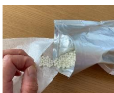
1.不織布袋にビーズを入れる

ご使用いただく際は不織布性の袋(お茶パックなど)に入れていただき、さらにガーゼで包むと散らばる心配もなく使いやすいのでお勧めです。