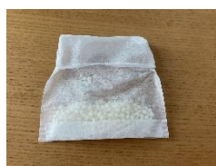
2.ビーズがこぼれないように口を折り返す