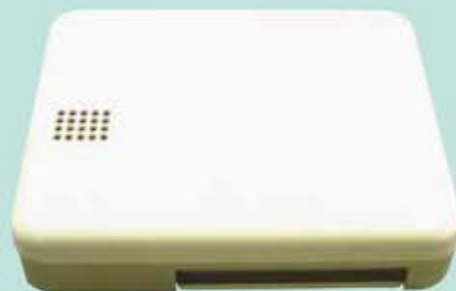
ミニ・フォレスト バッテリー

「居室ごとの対策をしないことには、施設のニオイの問題の解消は難しい。」 というお声をよく聞きます。ミニ・フォレストはシリーズは、 そんなお悩みを解決する、居室ごとに設置できる小型消臭器です。